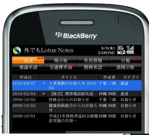
メイン画面イメージ