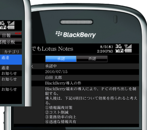
詳細画面イメージ